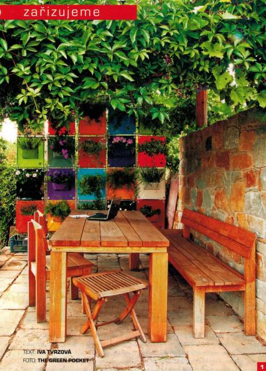
TEXT: IVA TYRZOVÁ